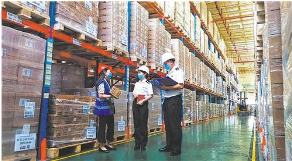
广州海关所属南沙海关关员在文化保税仓库巡仓

从保税港区到自由便利度和开放程度都更高的综合保税区，广东自由贸易试验区南沙片区对外开放平台的升级，正在为 324 家综保区企业带来实实在在的便利。目前京东、天猫、考拉海购、惠而浦、松下等众多品牌已进驻综合保税区，形成了国际物流、新兴产业多元化发展的产业平台。众多企业纷纷利用区内政策优势，积极开拓国内国际两个市场，谋求更大发展。