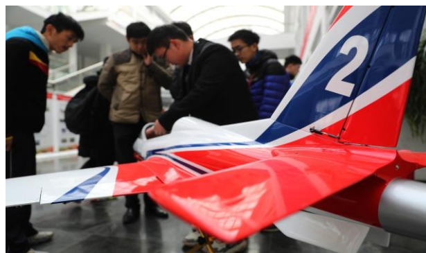
大学生在给观众展示飞行平台快速滑行。